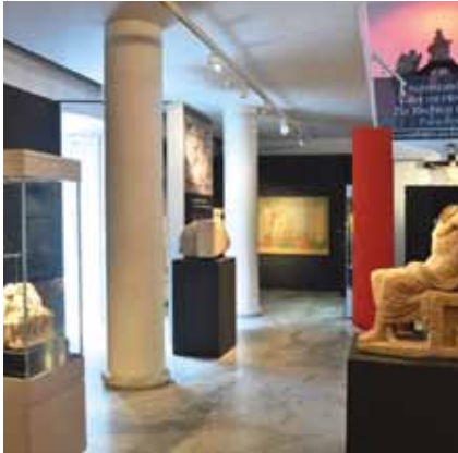
Sonderausstellung »Nero und die Christen«