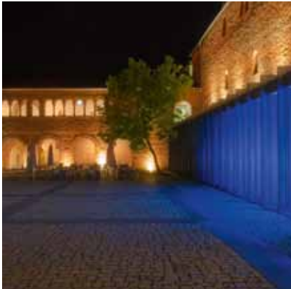
Innenhof des Stadtmuseums Simeonstift Trier

22:30 Uhr: FreedomBus 3D-Video Mapping und Performance vor der Porta Nigra