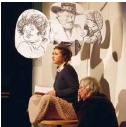
Szene aus dem Schmackeduzchen