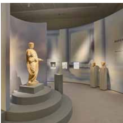
Blick in die Nero-Ausstellung