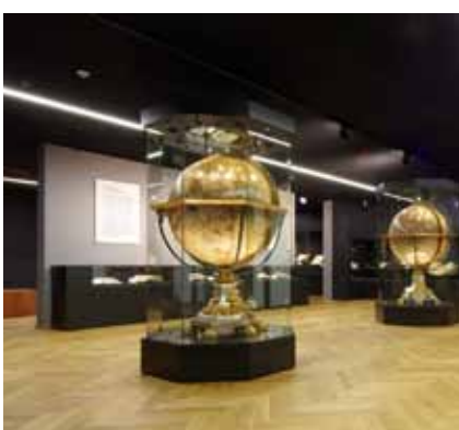
Blick in die Schatzkammer